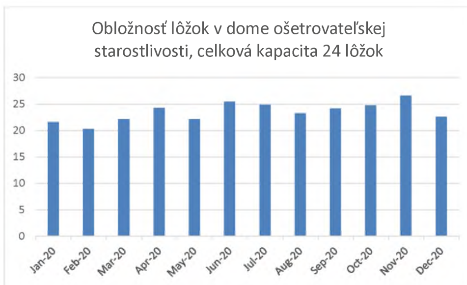
Graf 4. Obložnosť lôžok v dome ošetrovateľskej starostlivosti v mesiacoch január-december 2020