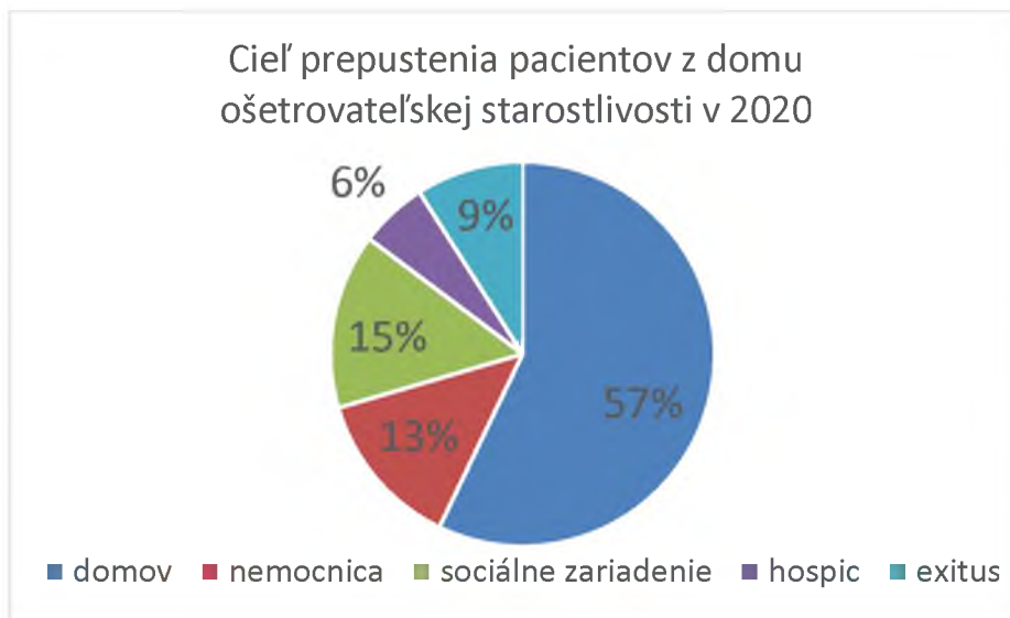
Graf 3. Cieľ prepustenia pacientov z DOSu v roku 2020