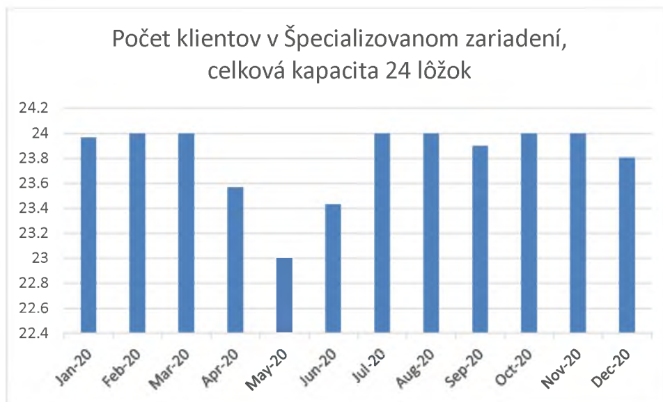
Graf 1. Počet klientov v špecializovanom zariadení v mesiacoch január-december 2020

Prehľad počtu klientov v priebehu mesiacov január až december 2020 znázorňuje Graf 1.