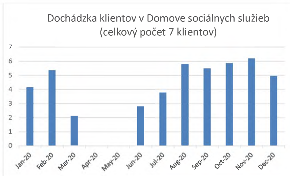
Graf 2. Dochádzka klientov v domove sociálnych služieb v mesiacoch január-december 2020