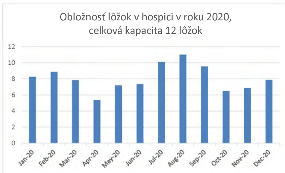
Graf 6. Obložnosť lôžok v hospici v mesiacoch január-december 2020

V roku 2020 sa nám nepodarilo naplno kapacitne využiť 12 hospicových lôžok. Obložnosť lôžok dosiahla v priemere 67,25%, vývoj v priebehu mesiacov január až december 2020 znázorňuje Graf 6. Hlavnou príčinou menšej obložnosti hospicových lôžok je skutočnosť, že VŠZP nám zazmluvnila iba 6 lôžok z celkovej kapacity 12. Finacovanie hospicovej starostlivosti samoplatcovsky je pre pacientov nedostatočný