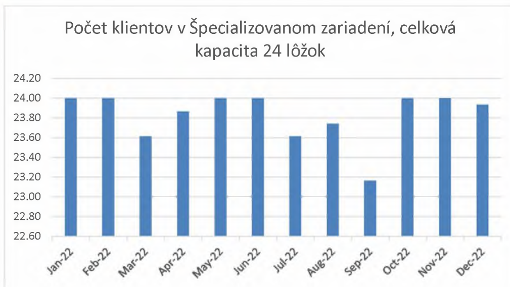
Graf 5. Počet klientov v špecializovanom zariadení v mesiacoch január-december 2022