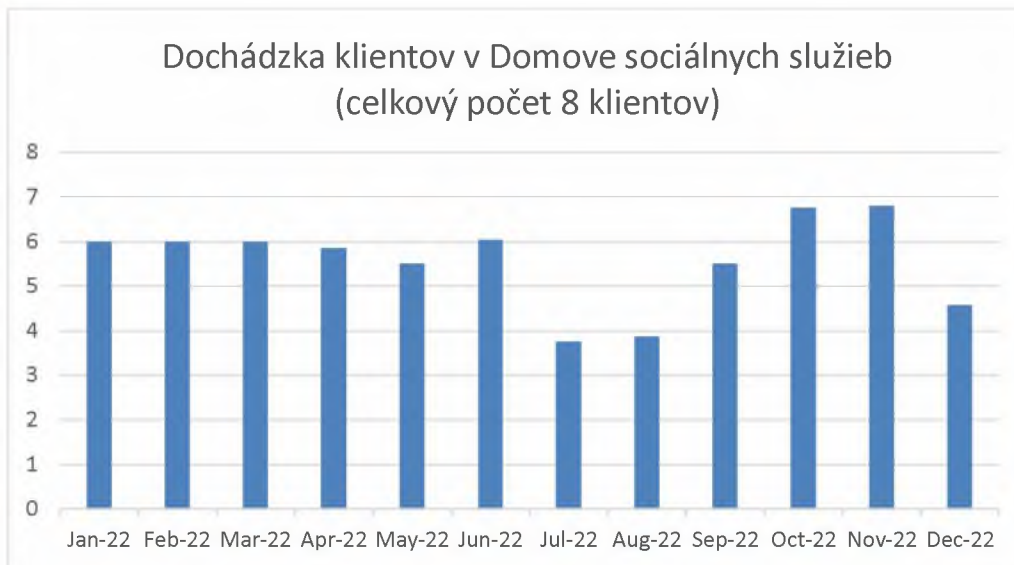
Graf 6. Dochádzka klientov v domove sociálnych služieb v mesiacoch január-december 2022