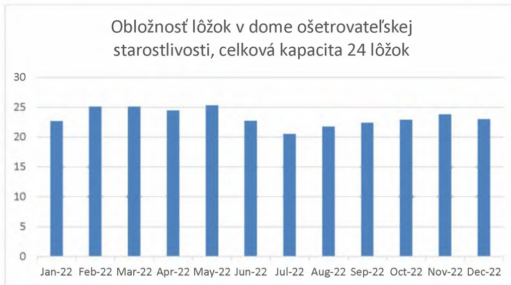
Graf 2. Obložnosť lôžok v dome ošetrovateľskej starostlivosti v mesiacoch január-december 2022

Ako je vidieť na Graf 2, v mesiacoch február, marec a máj 2022 obložnosť prekročila plnú kapacitu DOSu, t.j. 24 lôžok. Stalo sa tak v situáciách, kedy sme pacientov umiestnených na hospicovom oddelení prijímali do DOSu z dôvodu neukončenej liečby. Išlo o pacientov v závažnom zdravotnom stave, ktorí nemohli byť indikovaní do hospicu napr. z dôvodu, že dostávali ešte chemoterapiu alebo rádioterapiu.