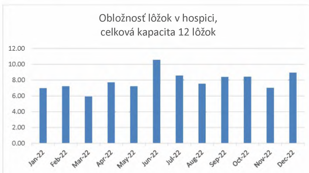
Graf 4. Obložnosť lôžok v hospici v mesiacoch január-december 2022

V roku 2022 sa nám nepodarilo naplno využiť kapacitu 12 hospicových lôžok. Obložnosť lôžok dosiahla v priemere iba 65,58 %. Počet obsadených hospicových lôžok v priebehu mesiacov január až december 2022 znázorňuje Graf 4.